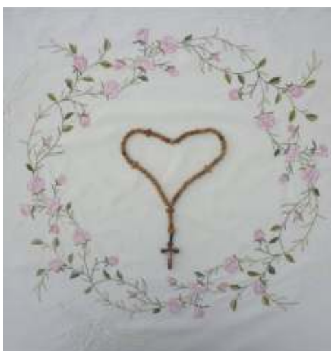
Rozenkrans uit Bethlehem

(Gertrude Stein, in Secret Emily , 1913)