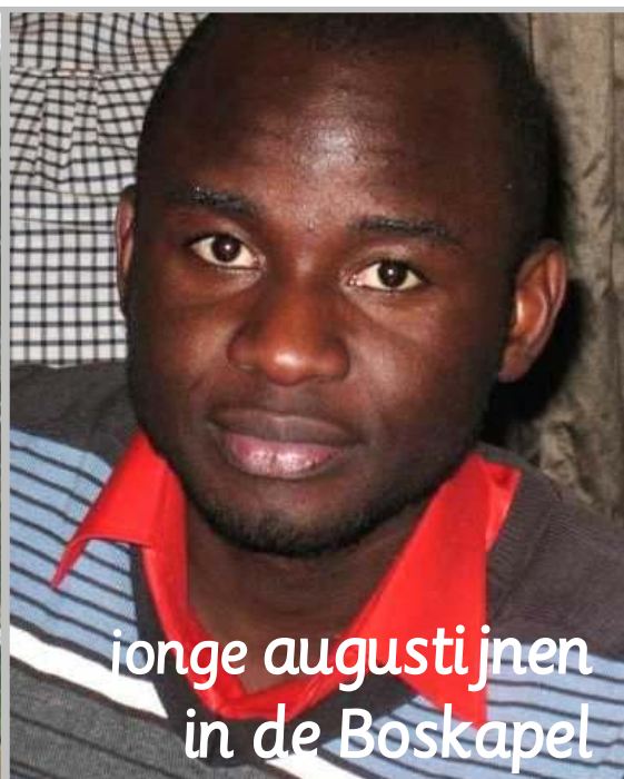
jonge augustijnen in de Boskapel