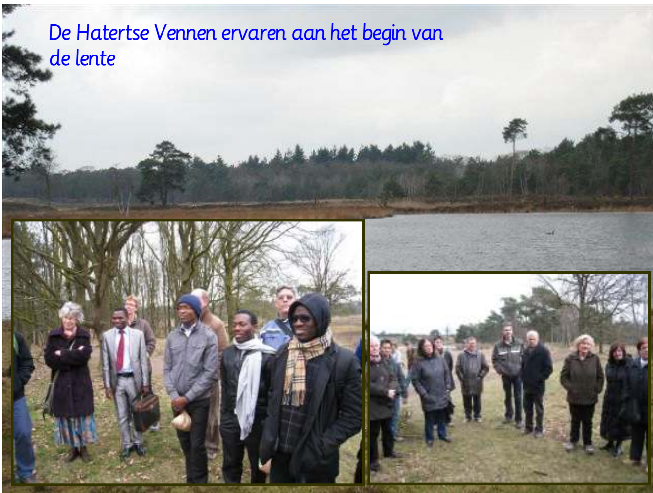
De Hatertse Vennen ervaren aan het begin van de lente