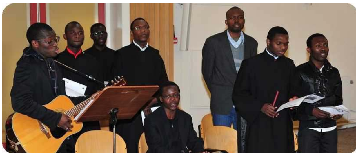
De jonge augustijnen tijdens de viering van 18 maart 2012 in de Boskapel