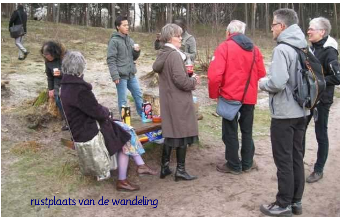
rustplaats van de wandeling