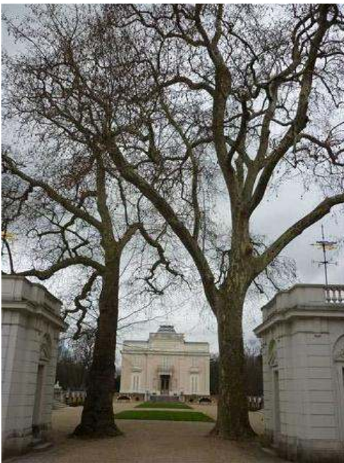
Bois de Boulogne, Parijs zondagochtend 18-03-2012

De Romeinse dichter Ovidius, die leefde omstreeks het begin van onze jaartelling, beschreef de Griekse mythe van Philemon en Baucis. Het gaat over twee oude mensen, die in hun huisje twee vreemdelingen ontvangen, die later goden blijken te zijn. Zij worden voor hun gastvrijheid beloond en hun eenvoudige huisje verandert in een tempel. Ook hun liefste wens, altijd bij elkaar te mogen blijven zal in vervulling gaan. Daarvoor veranderen zij uiteindelijk in twee bomen, een eik en een linde, die met hun stammen en takken verstrengeld voor altijd de ingang van de tempel bewaken. Vele schrijvers, dichters, musici en schilders hebben zich in latere eeuwen door dit Philemon en Baucis-thema laten inspireren. Het zal u niet verbazen dat ook ik moest denken aan Philemon en Baucis toen