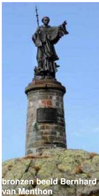
bronzen beeld Bernhard van Menthon

Op de ruïne daarvan heeft Bernhard van Menthon, een edelman uit Savoye, een klooster gesticht waar volgelingen van Augustinus, de Augustijner Koorheren, hun intrek namen. In de Lage Landen hebben zij vóór de Reformatie talrijke kloosters gehad, o.a. in Friesland. Het klooster lag op een onherbergzame plek: de gemiddelde temperatuur schommelt er rond plus 2 °C., van november tot juni ligt er veel sneeuw en er wil niets groeien. Eeuwen lang was het klooster het hoogstgelegen huis in de Alpen. Onder de bergpas loopt nu een toltunnel, die permanent verkeer tussen Zwitserland en Italië garandeert. De bergweg is in de winter gesloten.